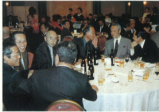
2000年に開かれた、創立50周年祝賀会